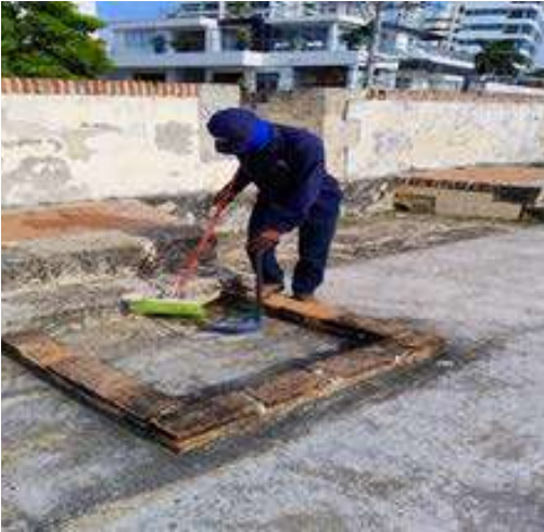
Limpieza general al Fuerte