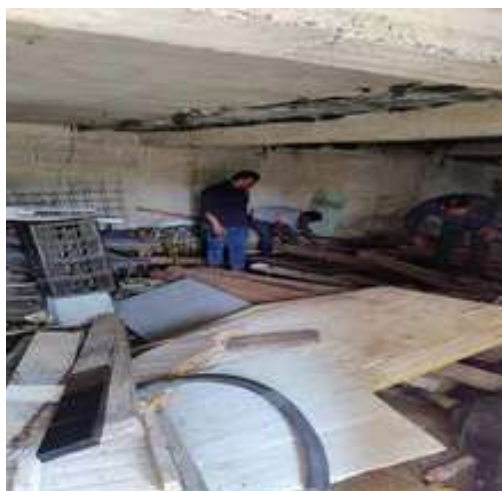
Limpieza de material no aprovechado en bodega del Fuerte