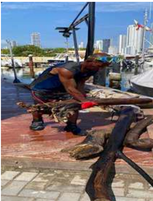
Jornadas de Limpieza Submarina