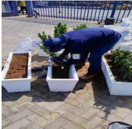
Siembra de corales en macetas