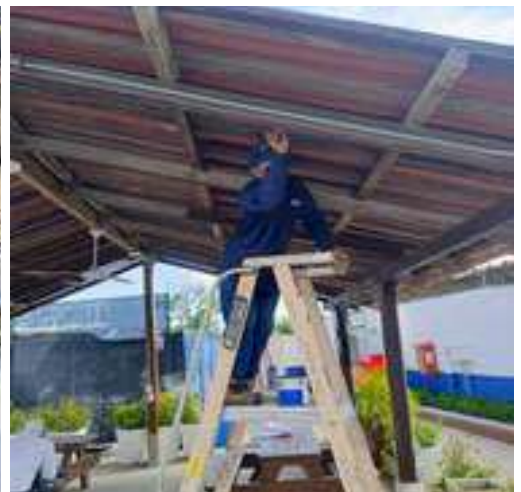
Mantenimiento techo Kiosco de pilotos.