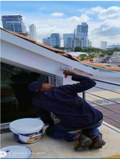
Pintura en techo del Mirador