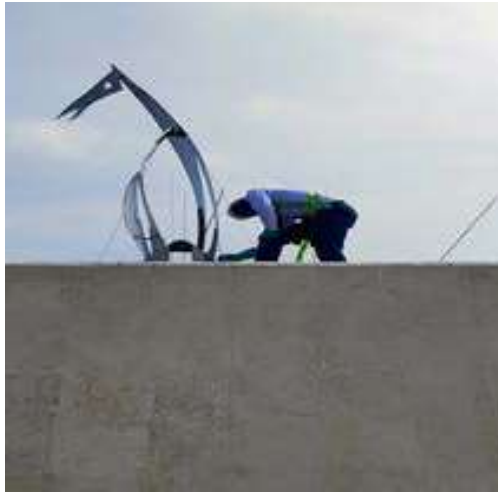
Limpieza y brillo a velero encima de los baños