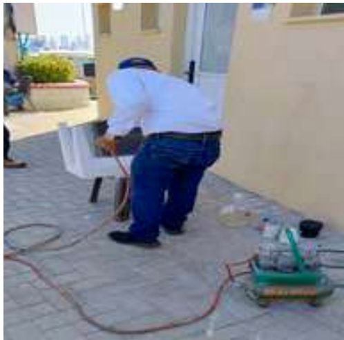
Pintura para mesas pequeñas de baños de mujeres