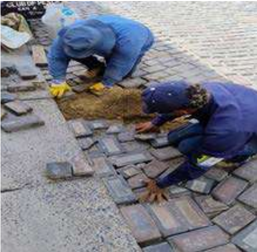
Se corrige desnivel en adoquines de entrada al Fuerte