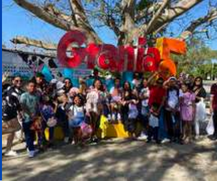
Dic. 2025 Navidad hijos de empleados. En "La Granja de los Abuelos"