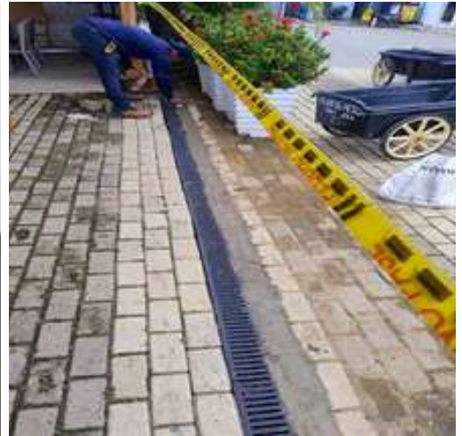
Instalación de grilleras para desague en la Dársena