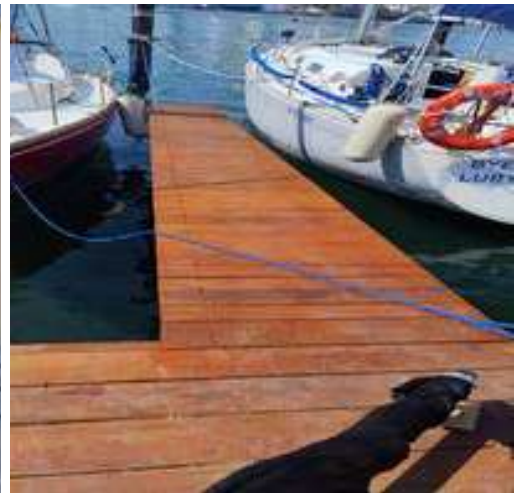
Se alarga el finger de la embarcación Mensi