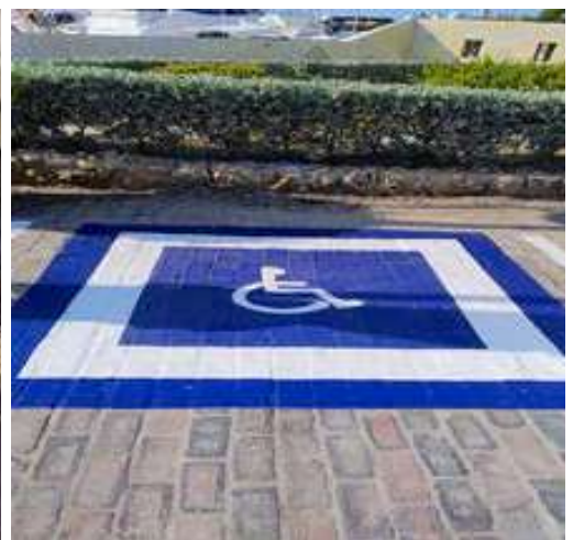
Señalización de parqueadero para discapacitados