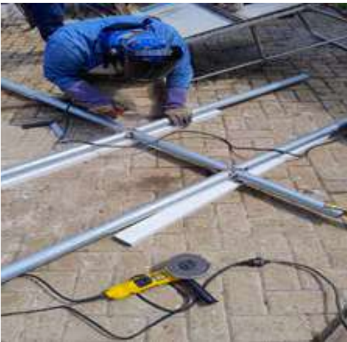
Construcción de racks para los Sunfish