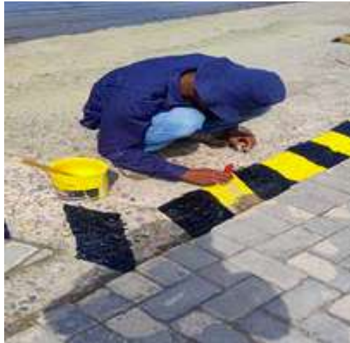
Se pintan las líneas de seguridad de la rampa frente a la Dársena