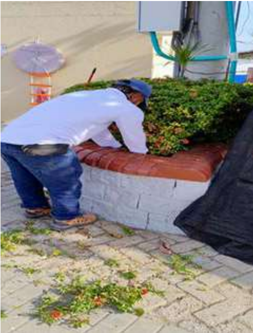
Limpieza y poda de jardines internos