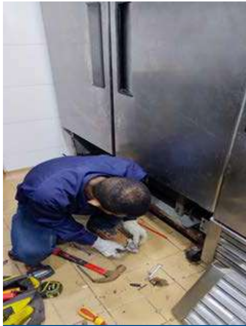
Mantenimiento a puertas de las neveras de la cocina