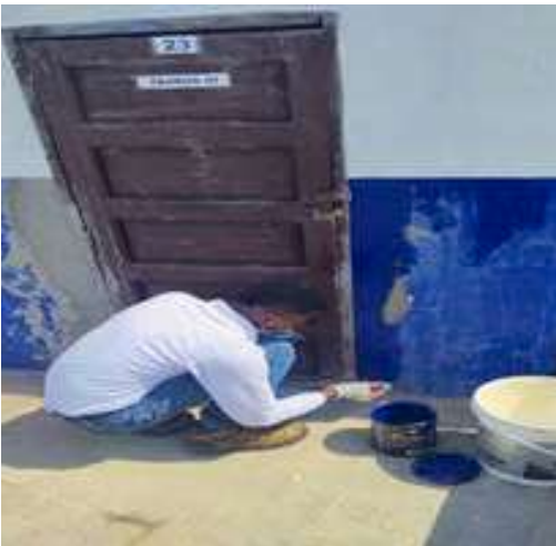
Mantenimiento de paredes de lockers