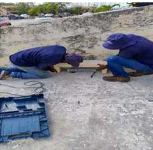
Ubicación de luz con nicho para protección