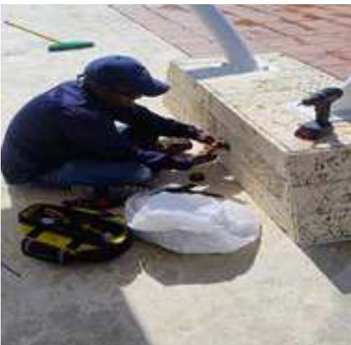
Se instalan tomas eléctricas en la Carpa Movistar