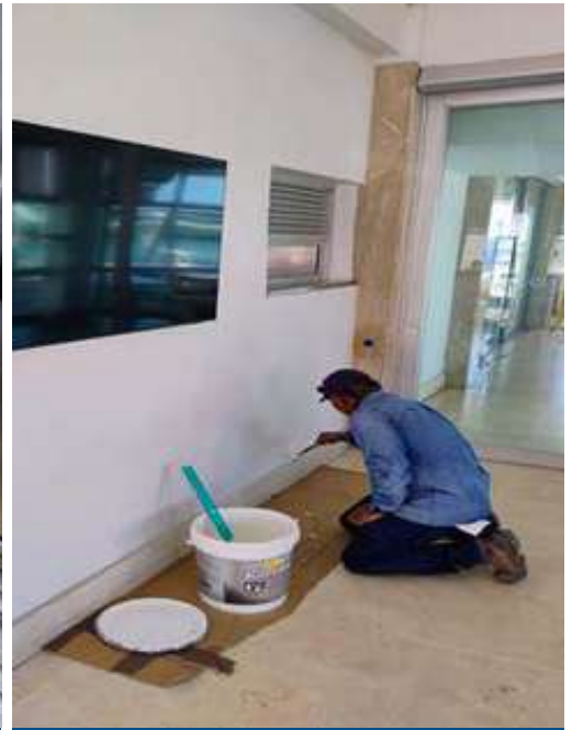
Pintura en paredes