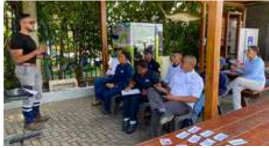
Nov. 2025 Capacitación Etiquetado de productos químicos