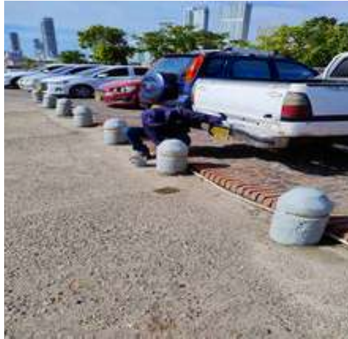
Pintura para los bolardos de la Plaza de Armas