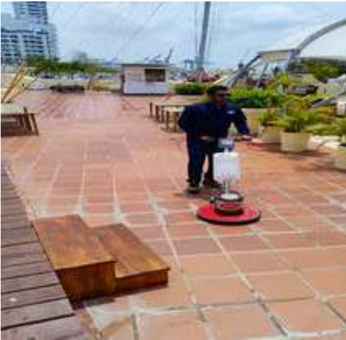
Limpieza y brillo en Carpa Movistar