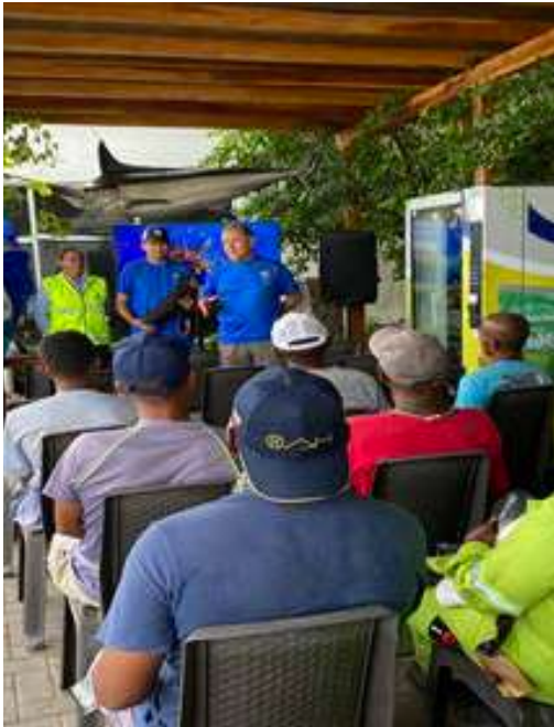
Inducción a pilotos por parte de buzos profesionales