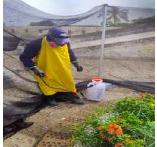
Cierre de jardineras para efectuar fumigación