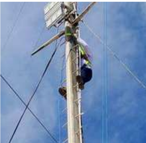
Cabo nuevo en el mástil para la bandera nacional