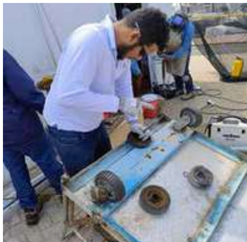
Mantenimiento de carretillas. Cambio en ruedas y pintura