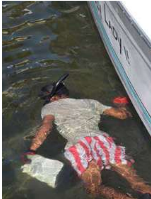
Jornadas de Limpieza Submarina