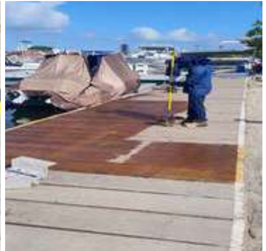
Se pintan con perfilan las tablas de Muelle #2