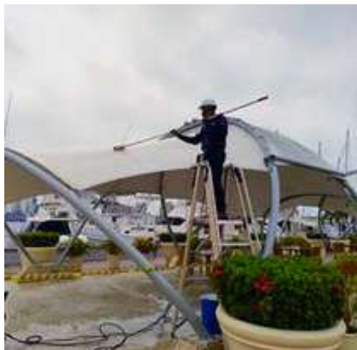
Lavado Carpa Movistar