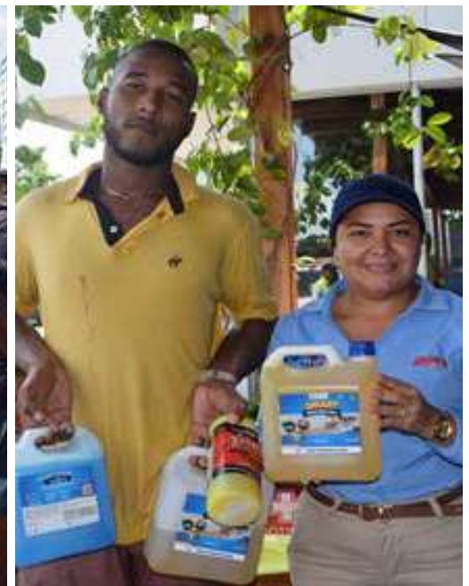
Premiación de participantes