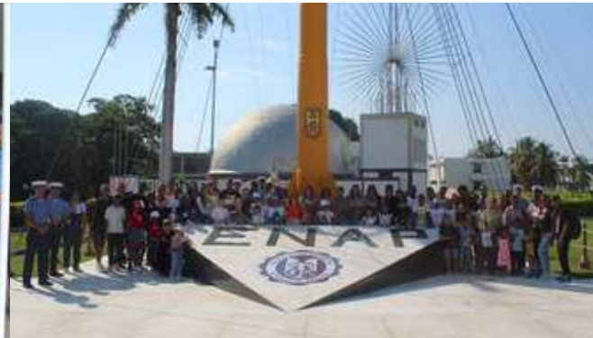
Dic. 2025 Visita a la escuela Almirante Padilla, para los hijos de los pilotos