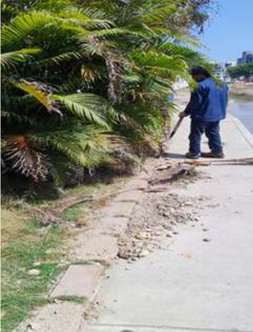
Limpieza general de jardines externos