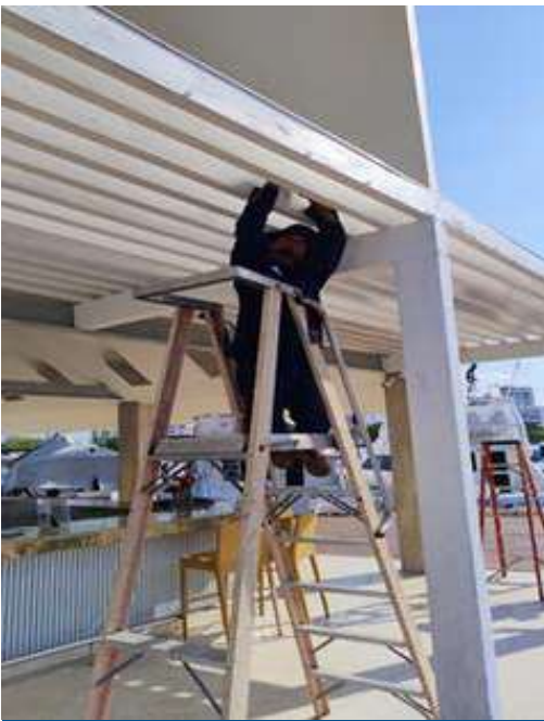
Mantenimiento y pintura de la pérgola del Kiosco