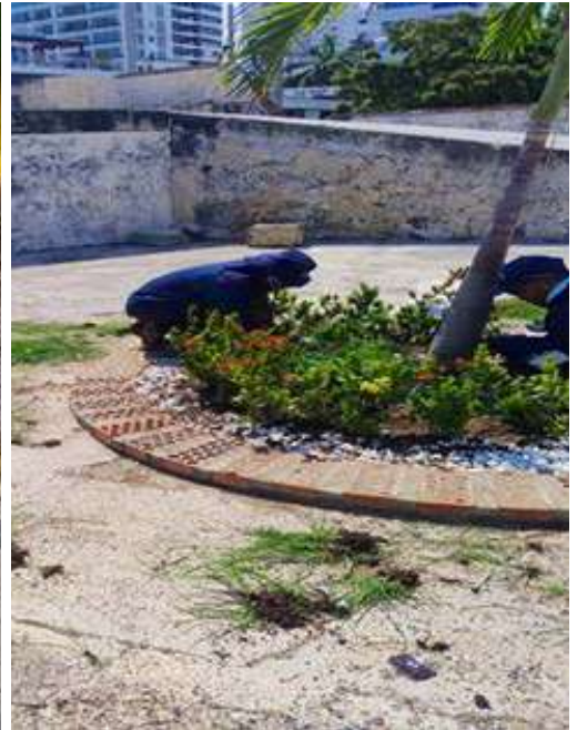
Limpieza de maleza en jardines externos