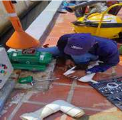
Jornada de Glucometrías, PVE Cardiovascular