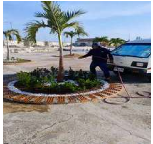
Siembra de matas al rededor de las palmeras