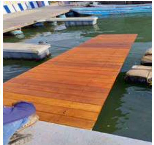
Construcción de 2 fingers en Muelle #3