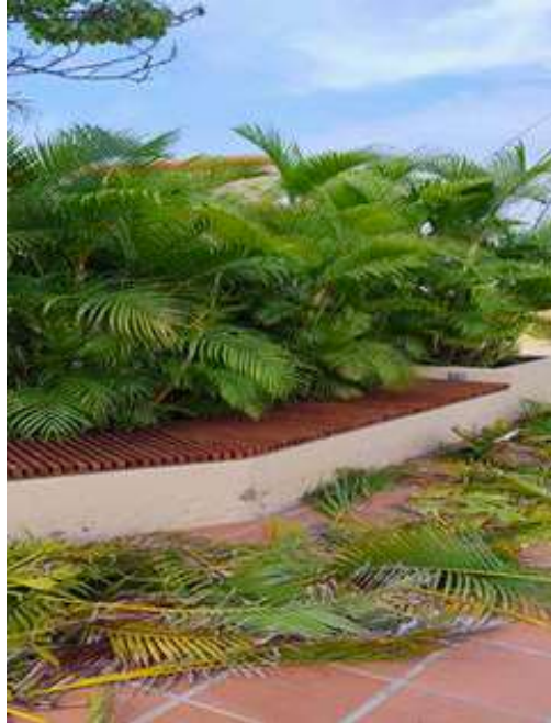
Se podan los jardines frente a la Sala de Juntas