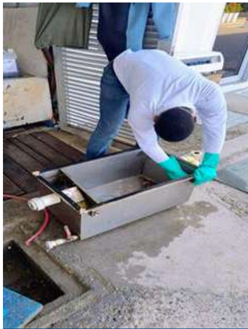
Limpieza trampa de grasa de la cocina