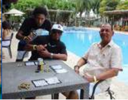
Dic. 2025 Pasadía de fin de año para los empleados.