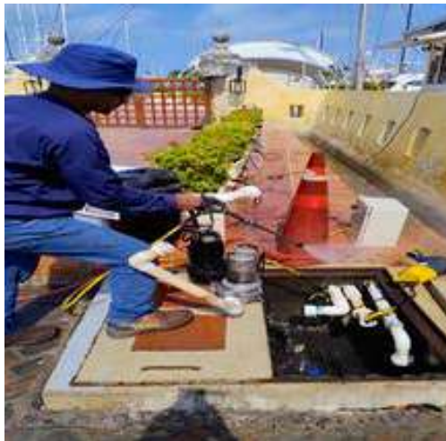
Mantenimiento bomba de achique de aguas lluvias