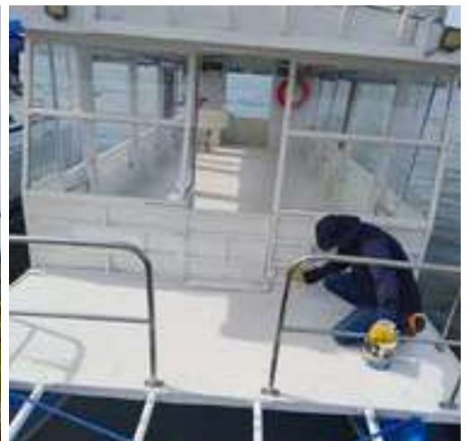
Se pinta la cubierta del ACUABUS