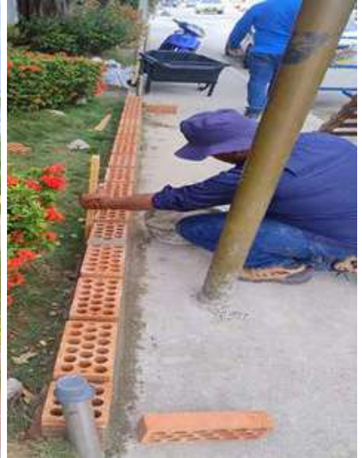
Remodelación jardinera externa